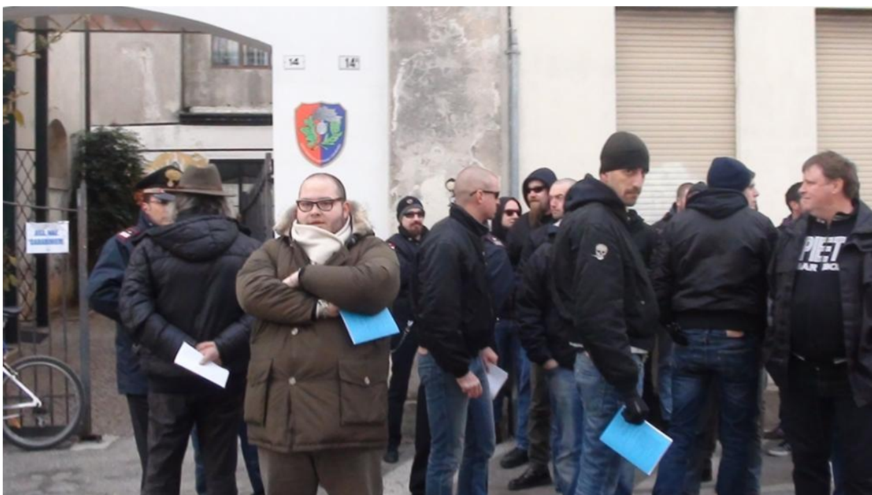
Schierati davanti alla sede ANPI a Montebelluna, in attesa di seguirci al convegno.

Consapevoli di avere assistito a nuove prove tecniche di squadristo, che non ci fanno bene sperare nel futuro democratico del nostro Paese, la nostra intenzione di Resistenti storici è di continuare a dare il massimo di informazione su queste tematiche: continueremo a fare iniziative e convegni, a scrivere e pubblicare, a smentire chi pretende di abusare della storia per dare sfogo alle proprie ideologie che non dovrebbero più avere diritto di cittadinanza.