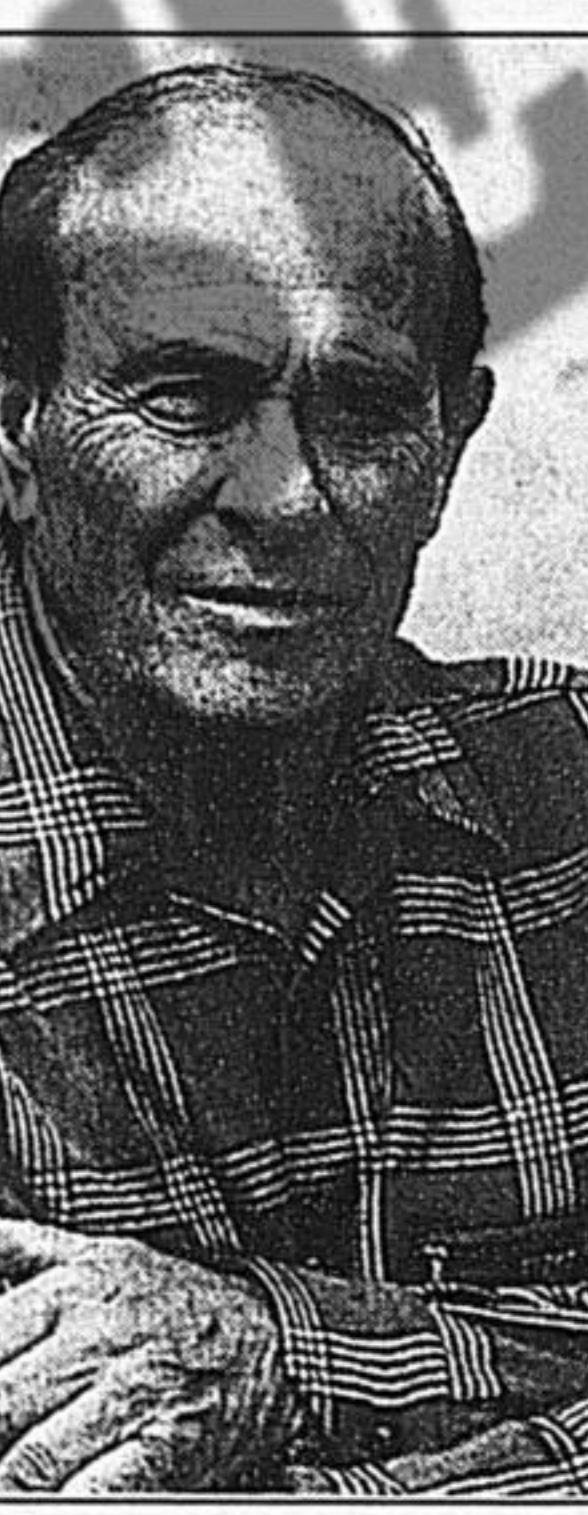
Giorgio Bocca, 72 anni

dici, agli avvocati onesti e disonesti, più ancora dei resoconti di crimini irrisolti, più delle precise denunce sulla corruzione dilagante e sul malcostume, sono impressionanti, dell' Inferno di Giorgio Bocca, certi squarci fulminei sulla gente comune, sui paesaggi cadenti, sulle città sfasciate, sul Palazzo di Giustizia di Palermo, sul Policlinico di Bari e sui topi enormi e immobili che ne abitano le cucine, sul «fantasma pietrificato» del teatro Petruzzelli, sui treni che portano i ragazzi calabresi verso un futuro inesistente, sulla casa gialla dell'orrore in una montagna dell'Aspromonte, la cui luce