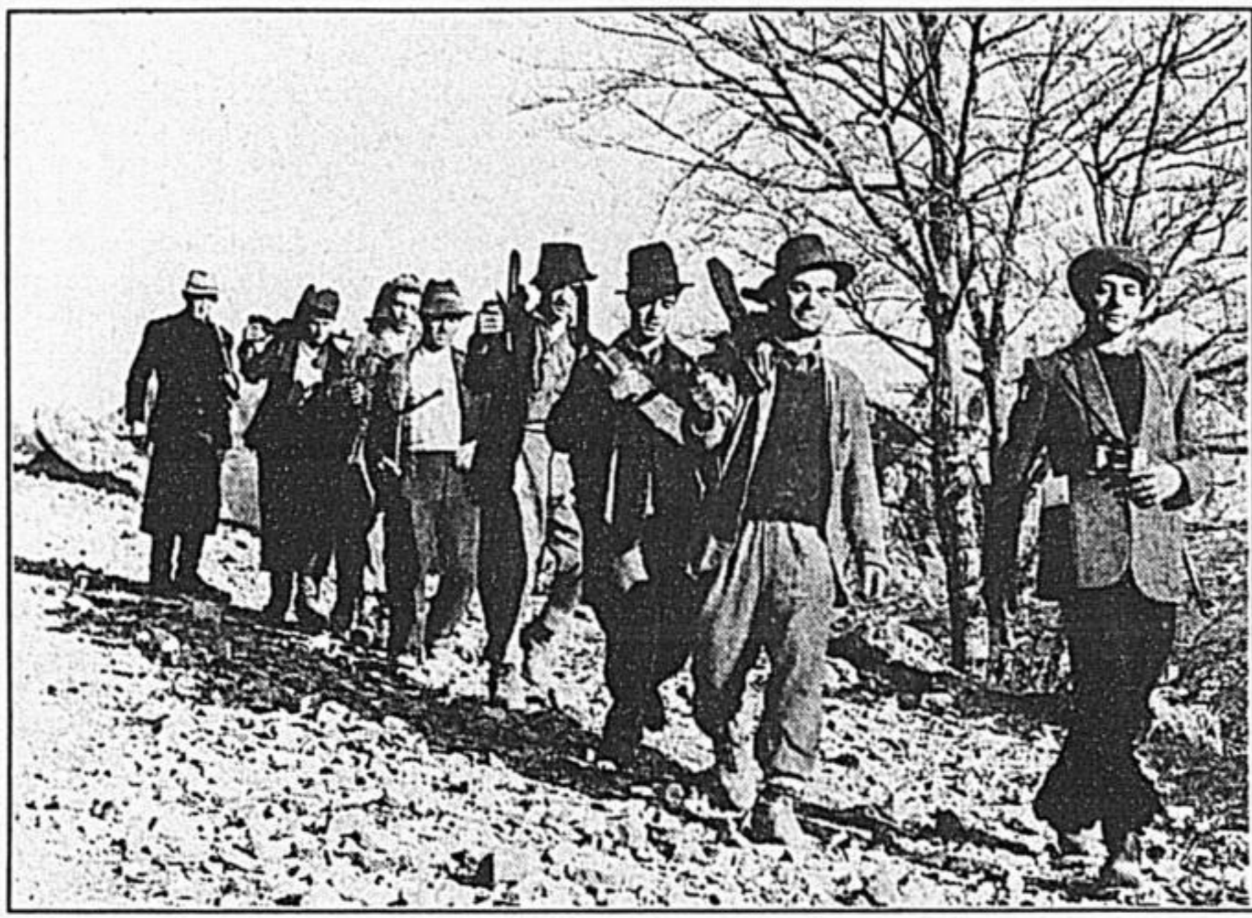
Una banda partigiana. A lato, 25 aprile: i partigiani scendono nelle città del Nord in festa

Ancora, gli operai non fecero niente per far cadere il fascismo il 25 luglio e tutto sommato